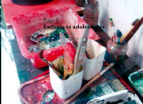
Page 8 Enfants et adolescents