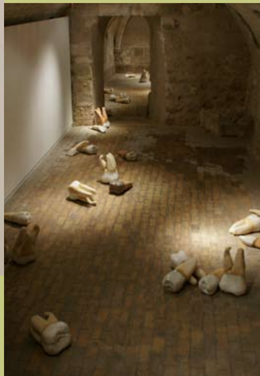
Rachel Labastie, résidence 2011

Les étudiants bénéficient d'un atelier qui est réservé à leur seul usage et profitent de tous les autres espaces de travail et ateliers spécifiques (dessin, peinture, terre, volume, sculpture, photographie argentique et numérique, gravure, communication visuelle et textile). En fonction des nocturnes réservées aux ateliers pour adultes, les étudiants peuvent travailler dans leur salle en soirée mais aussi à l'heure du déjeuner.