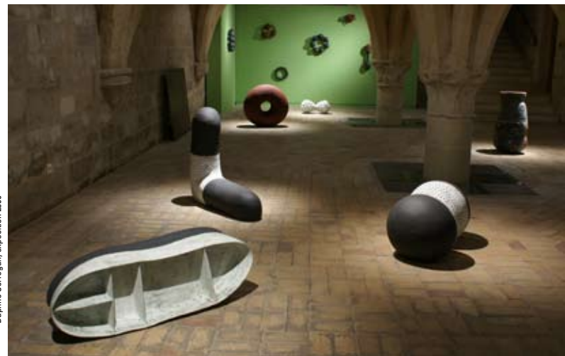
Daphné Corregan, exposition 2019

En outre, une information régulièrement mise à jour sur les formations artistiques et les écoles supérieures facilitent l'orientation des étudiants.